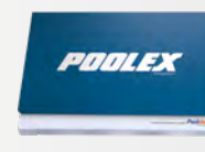
Caja de mantenimiento incluido el manual de uso en varios idiomas