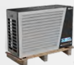
Entrega en palé de madera